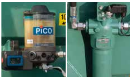
Wartung leicht gemacht